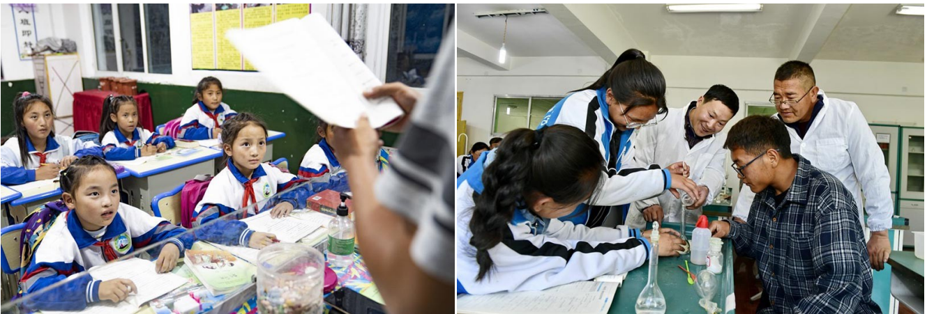
A gauche : Des élèves suivent un cours dans la ville de Qamdo de la région autonome du Tibet, le 14 septembre 2020. A droite : Un enseignant du Hubei et un enseignant local dirigent des élèves dans une expérience de chimie au lycée n° 1 de Shannan, dans la région autonome du Tibet, le 7 mai 2019.

A l'inverse, l'enseignement supérieur chinois est prioritairement axé sur le développement accéléré des sciences et techniques et est donc directement orienté vers l'effort de montée en gamme technologique tous azimuts du pays ! Pour la jeunesse chinoise fraîchement diplômée, l'incertitude du lendemain est aujourd'hui un sentiment inconnu. Quant aux étudiants et aux jeunes diplômés occidentaux, leur perspective générale se résume aujourd'hui en ces quelques mots : précarité et chômage croissants !